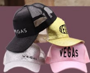
Шапка с козирка Vegas Ref. 5911 | 19,80 лв.